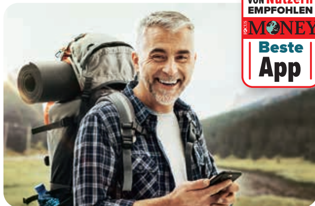
AKTIVURLAUB: Wetter-Apps warnen vor bösen Überraschungen

Mittelwerte, gerundet; Quelle: ServiceValue