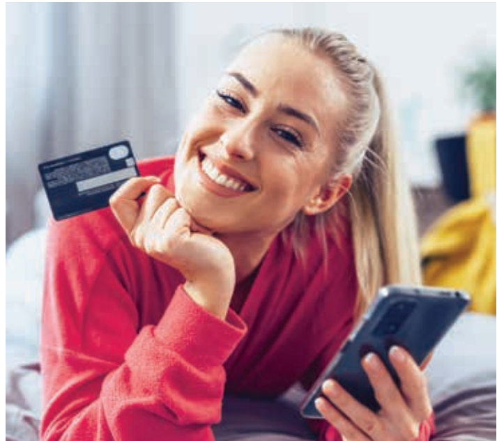
VERSAND ANGEKÜNDIGT: Beim Online-Shopping ist die Angebotsvielfalt unschlagbar