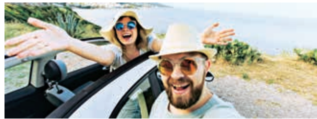
SCHÖNE ERLEBNISSE: via App in Eigenregie geplant und gebucht

Anreise und Unterkunft buchen sowie das Wetter vor Ort checken: Mit den richtigen Apps haben Urlauber gleich ein ganzes Reisebüro in der Tasche. Besonders in der Kategorie Wetter gibt es, wie zum Beispiel bei WetterOnline mit RegenRadar (2,30), sehr gute Bewertungen.